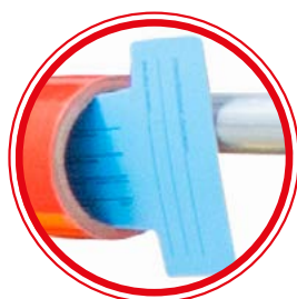
Media cards REF: PHTIEIR